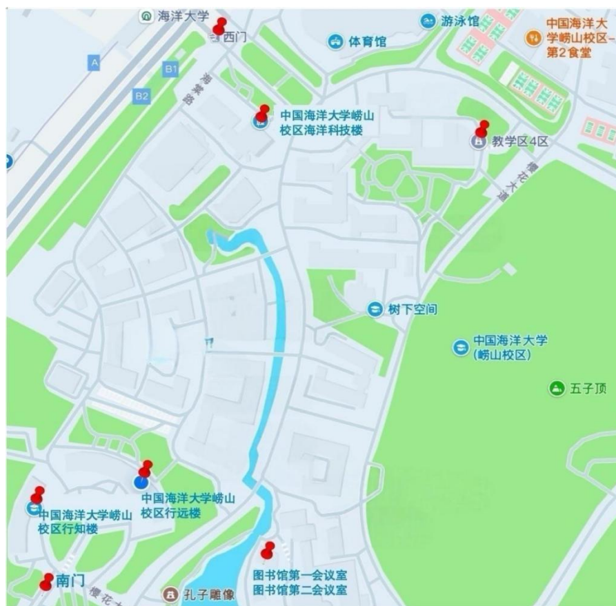
中国海洋大学崂山校区校内地图概览